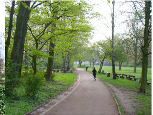
Der Hammer Park