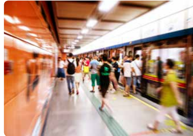
Wir platzieren Ihre Werbung in den Hamburger U-Bahn-Haltestellen