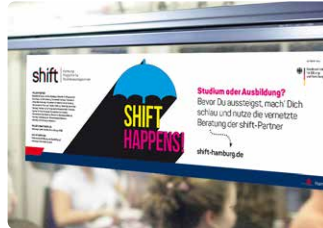
Wir platzieren Ihre Werbung auf den Seitenscheiben der Hamburger U-Bahnen und Bussen der Hamburger Hochbahn AG

Abweichende Auflagen sind auf Anfrage möglich. Die Tarife sind nicht rabattierbar.