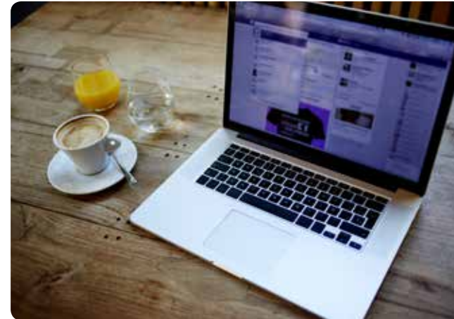
Wir platzieren Ihre Werbung zielgruppengenau bei Facebook