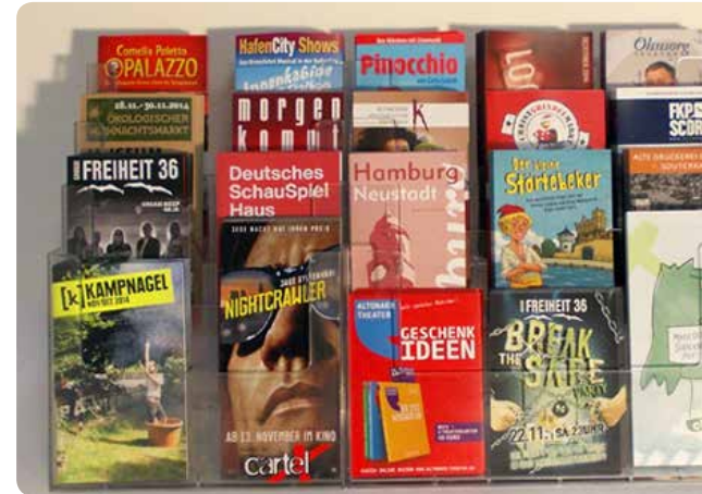
Wir platzieren Ihre Flyer in 340 Outlets der Hamburger Hotspot-Quartiere

Abweichende Auflagen und Werbemittelformate sind auf Anfrage möglich. Die Tarife sind nicht rabattierbar.