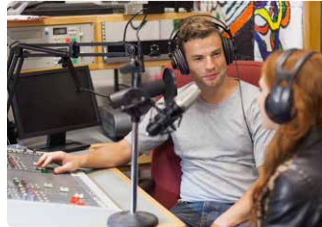
Wir platzieren Ihre Werbung im Radio