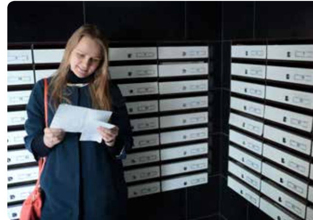
Wir platzieren Ihre Medien in den Briefkästen der Hamburger Studentenwohnheime

Verteilung zusammen mit dem UNISCENE-Magazin 25 %