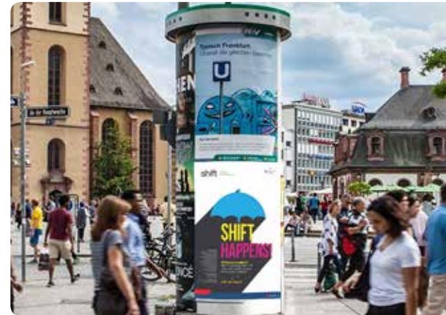
Wir platzieren Ihre Werbung auf den Hamburger Kultursäulen